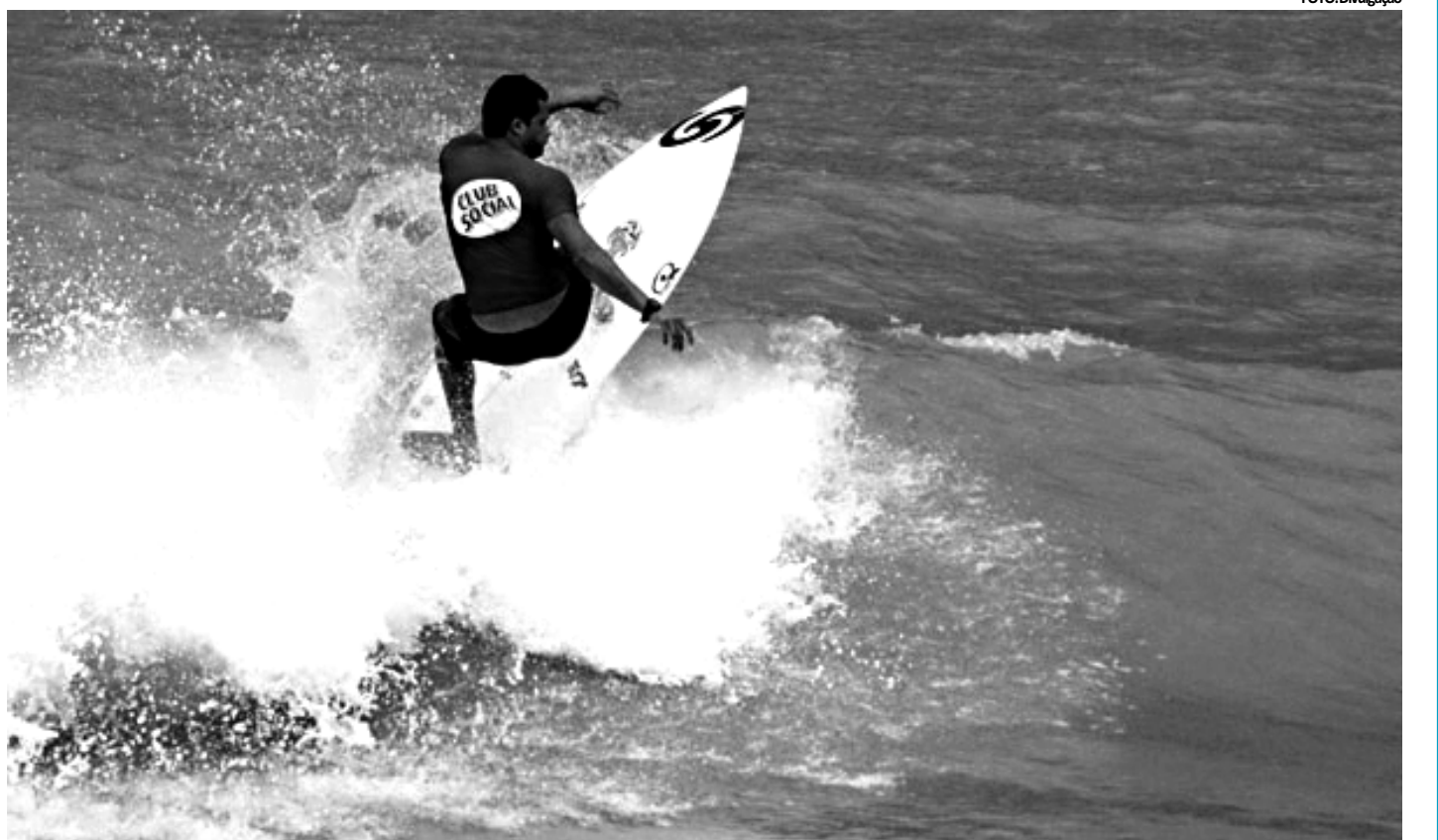
O final de semana promete altas manobras em Praia Bela, Litoral Sul do Estado, com as disputas do Circuito Paraibano de Surf