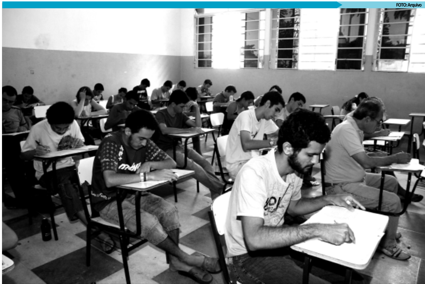
Alunos que fizeram os exames do PSS 2012 e que foram aprovados têm entre os dias 31 de janeiro a oito de fevereiro para fazer o cadastro obrigatório

Dentre os inscritos, na primeira etapa do PSS, 5.663 pessoas faltaram às provas, 119 foram eliminados por porte de celular e 201 foram desclassificados por obterem média zero em uma das ma-