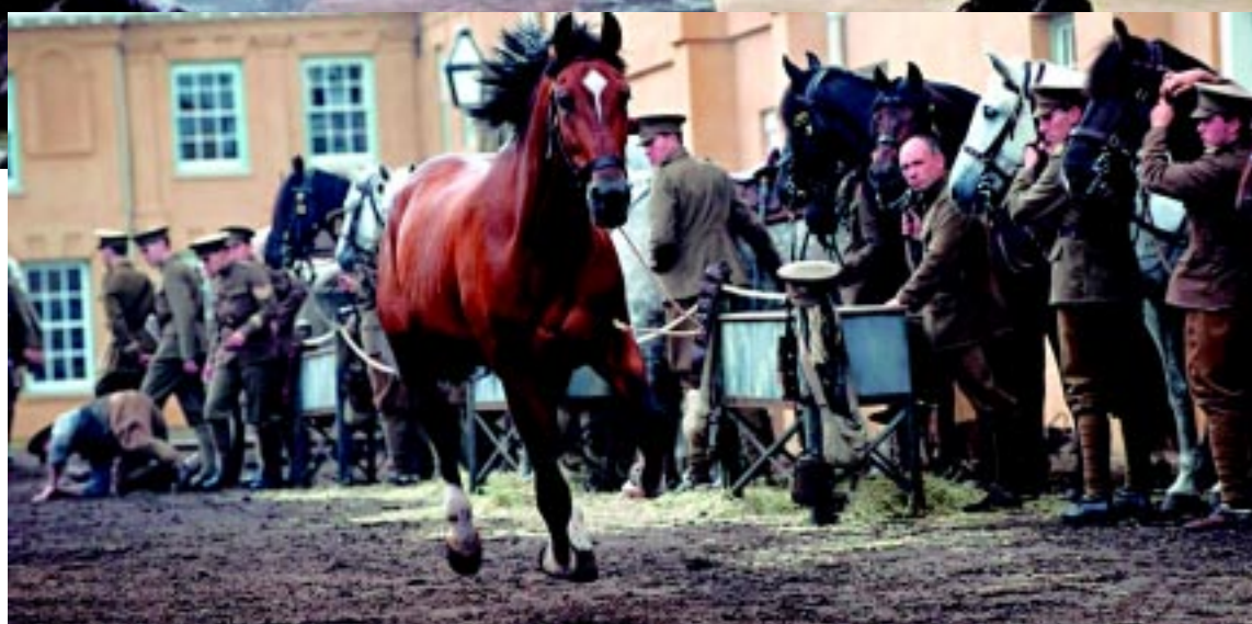
A Invenção de Hugo Cabret, de Martin Scorsese (acima) e Cavalo de Guerra, Steven Spielberg (ao lado) foram indicados ao prêmio de melhor filme