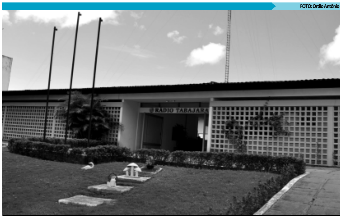
A Tabajara é uma das 100 rádios mais antigas do Brasil e mantém uma programação com músicas e depoimentos

Todos os candidatos e conselheiros seccionais devem comparecer à reunião, aberta a todos os advogados paraibanos e ao público em geral.