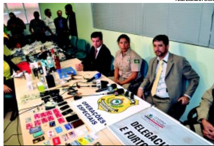
Polícia encontrou grande quantidade de produtos com o grupo