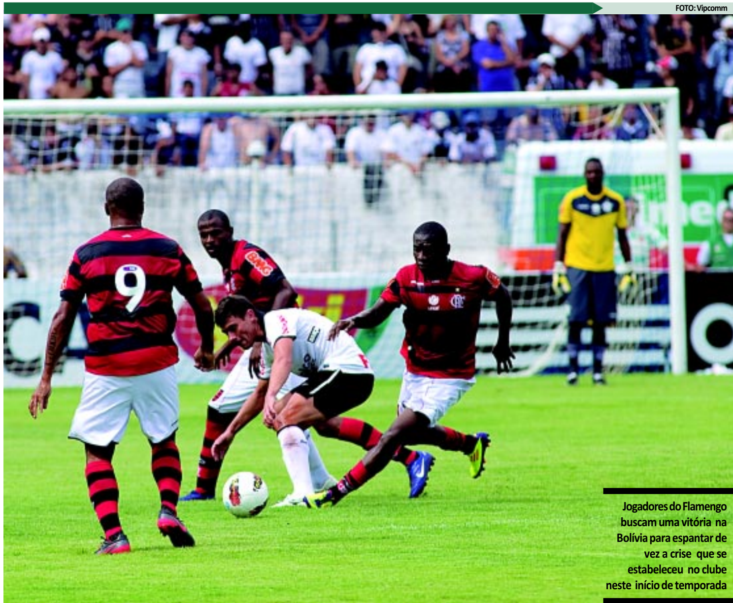
Jogadores do Flamengo buscam uma vitória na Bolívia para espantar de vez a crise que se estabeleceu no clube neste início de temporada

Após o jogo de hoje, as duas equipes voltam a jogar no dia 1 de fevereiro no Rio de Janeiro, quando então será definida quem ficará com a vaga para a fase principal da Libertadores.