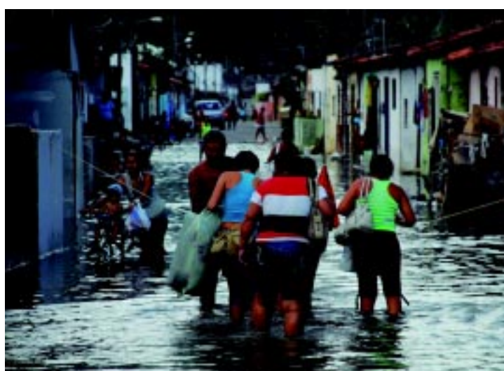
Em João Pessoa, a chuva derrubou quatro árvores, abriu crateras pelas ruas e alagou bairros ribeirinhos, deixando a Defesa Civil em alerta