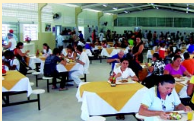
Três restaurantes do Estado fornecem 2,5 mil refeições diárias a R$ 1