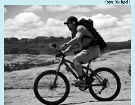
James Franco numa cena de 127 Horas, de Danny Boyle

>>> 127 HORAS - Em maio de 2003, o alpinista Aron Ralston fazia mais uma escalada nas montanhas de Utah, Estados Unidos, quando ficou com o braço preso em uma nova fenda. A partir daí ele começa uma luta para sobreviver, sendo obrigado a racionar água e comida. Depois de cinco dias ele descobre que uma forma de se soltar, mas ainda precisa descer por uma encosta de vinte metros de altura e caminhar por vários quilômetros até ser resgatado.