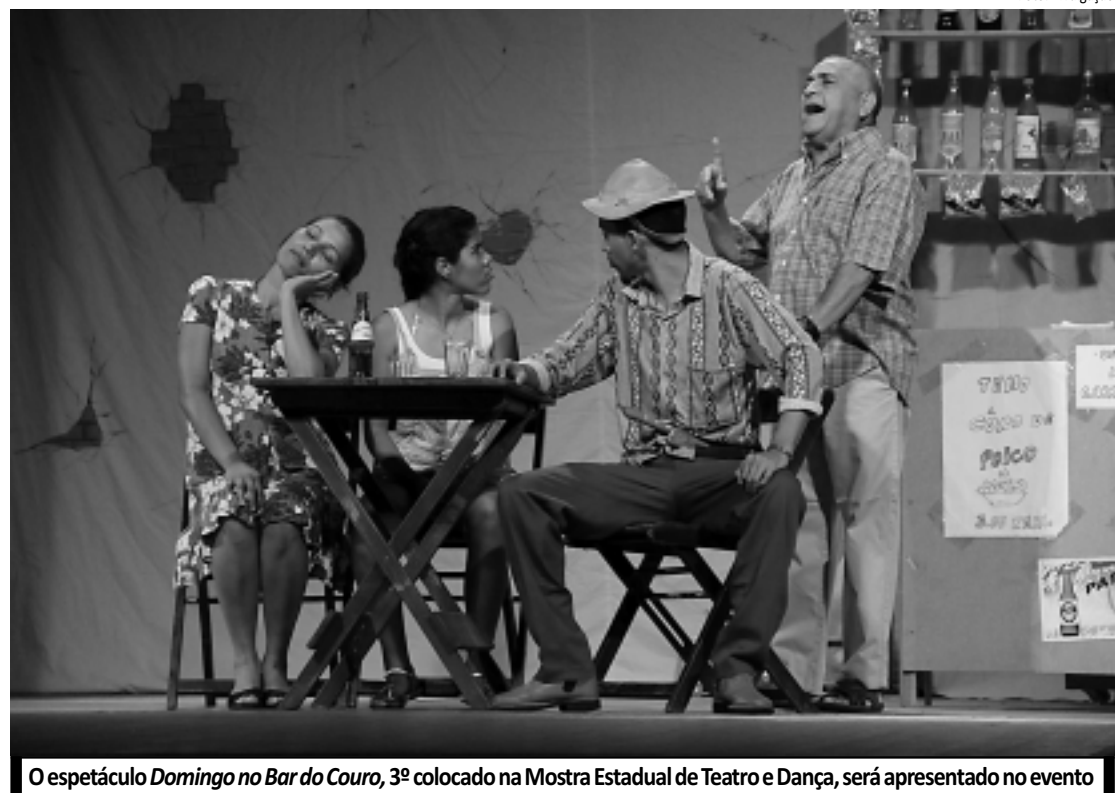
O espetáculo Domingo no Bar do Couro , 3º colocado na Mostra Estadual de Teatro e Dança, será apresentado no evento

Às 22h, começa a Noite do Forrock, com show da banda