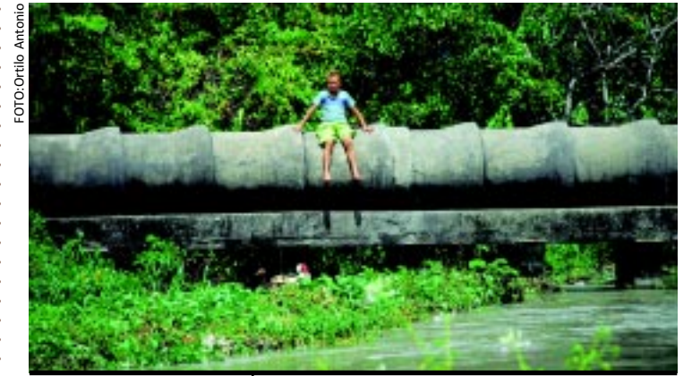
[FOTO&LEGENDA] Depois de uma noite de chuva intensa, no final da manhã, o sol abriu um pouco na Capital paraibana. Sentado nas manilhas que levam água ao bairro, o garoto observa o rio em seu nível elevado, na Comunidade Rio da Bomba.