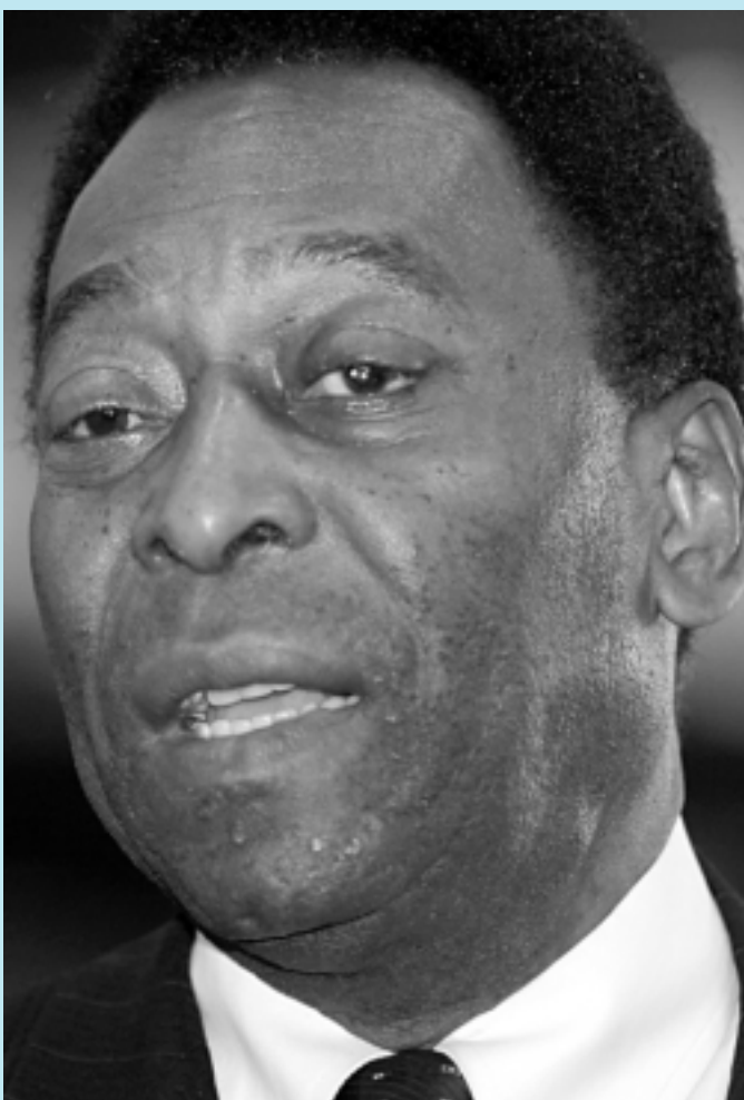
"Nunca haverá outro Pelé", diz o eterno camisa 10 do Brasil

"Ele (Messi) é um jogador fantástico. É uma verdadeira felicidade vê-lo em campo. Ele é o maior? Não sei. Da mesma forma que não sei se é possível compará-lo a Cristiano Ronaldo, que não tem o mesmo estilo", encerrou.