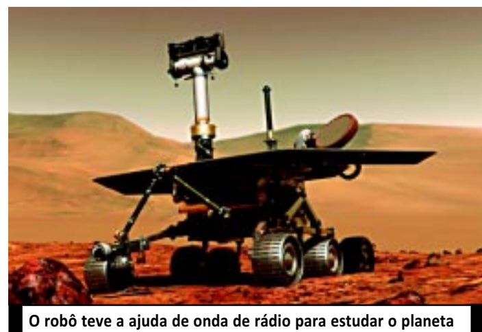
O robô teve a ajuda de onda de rádio para estudar o planeta

O Opportunity chegou a Marte três semanas depois de seu "irmão gêmeo", o Spirit. A missão original da dupla era buscar sinais de água no passado do planeta vermelho. Missão cumprida. Em locais de pouso opostos, tanto o Opportunity quanto o Spirit