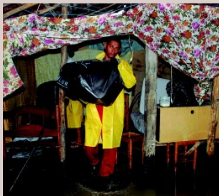
A Defesa Civil relocou quatro famílias do Rio da Bomba, localizada no bairro 13 de Maio para um abrigo improvisado numa escola pública

casas sem energia. A Defesa Civil relocou 4 famílias de área de risco na Capital para um abrigo improvisado numa escola pública. Vários pontos da cidade ficaram intransitáveis. PÁGINA 9