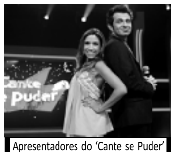
Apresentadores do 'Cante se Puder'