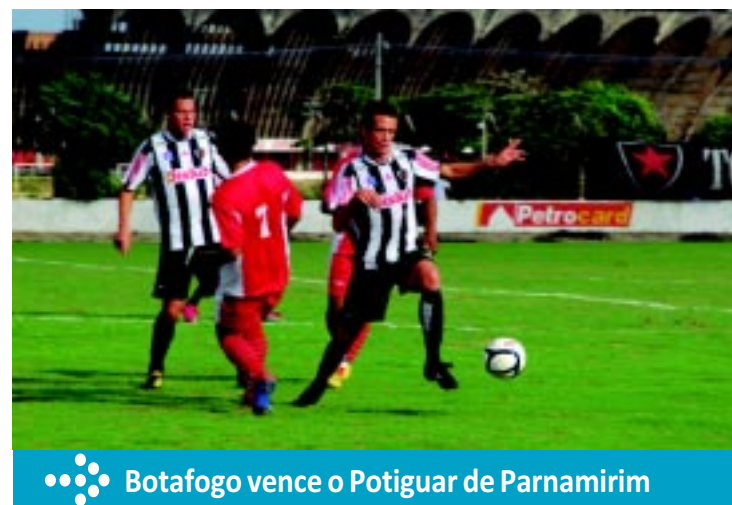
Botafogo vence o Potiguar de Parnamirim

em um apartamento no bairro de Intermarés, em Cabedelo. A polícia investiga o envolvimento deles com outros acusados, presos durante a "Operação Playboy". PÁGINA 11