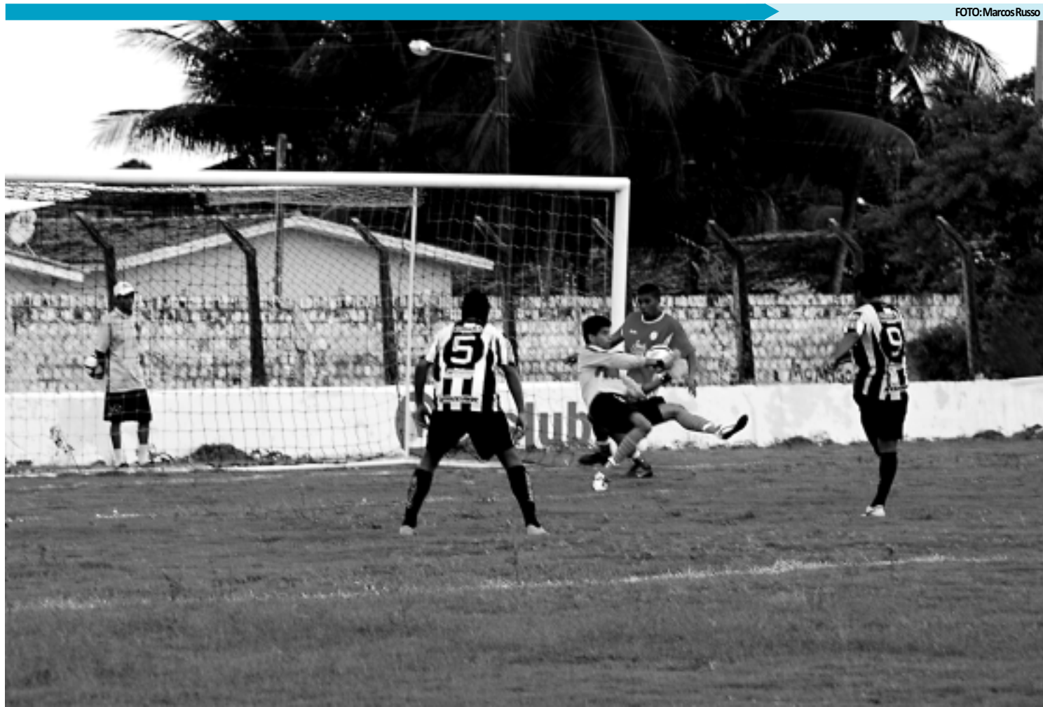
Mostrando muita superioridade técnica sobre o adversário, o Botafogo não teve dificuldades de atropelar o Potiguar de Parnamirim

No segundo tempo, o time comandado por Suélio Lacerda veio mais ligado e agredindo mais o Potiguar. Logo aos quatro minutos, Edgard em jogada individual passou por dois zagueiros e