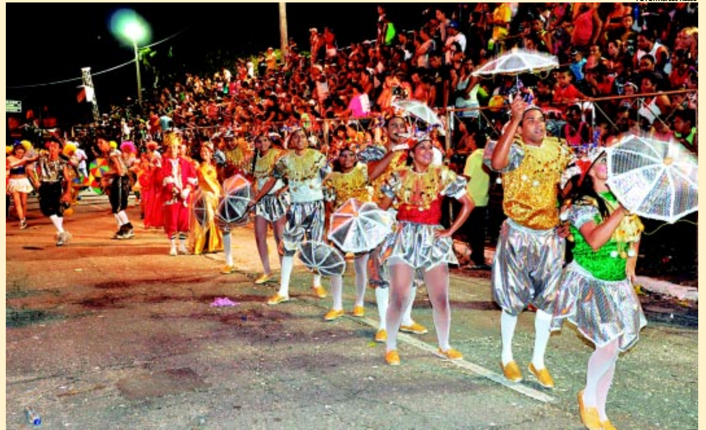
Carnaval Tradição receberá a Prefeitura Municipal R$ 235 mil, recursos que possibilitarão o desfile das agremiações e aquisições de fantasias