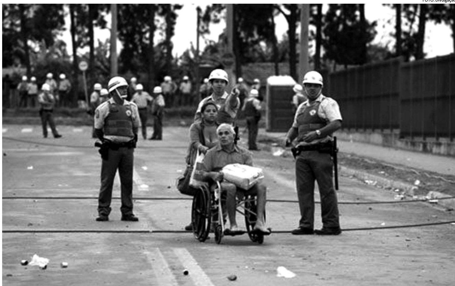
Moradores começaram a ser retirados da comunidade no domingo; eles não têm para onde ir e muitos perderam tudo com as demolições das casas

A Ampla, distribuidora de energia elétrica que atende a Baixada Fluminense informou que os moradores de Saracuruna, Campos Eliseos, Jardim Primavera, Figueira, Mauá e Parque Pinheiro, no município de Duque de Caxias foram afetados com a falta de energia. Ao todo 100 mil pessoas ficaram sem luz com o blecaute na cidade. Por volta de 11h36 a energia foi restabelecida, segundo a concessionária que atende a 66 municípios do Estado.